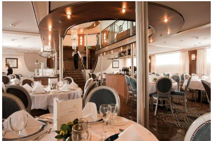
Panoramalounge und Bar mit Platz für 216 Gäste